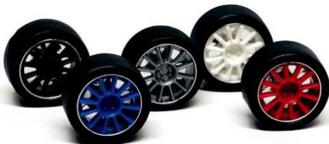
5424 - Ø 17mm BBS black