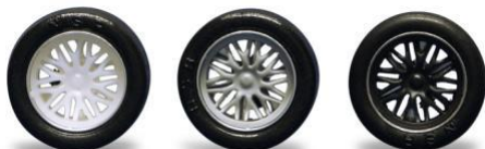
5422 - Ø 17mm BBS white